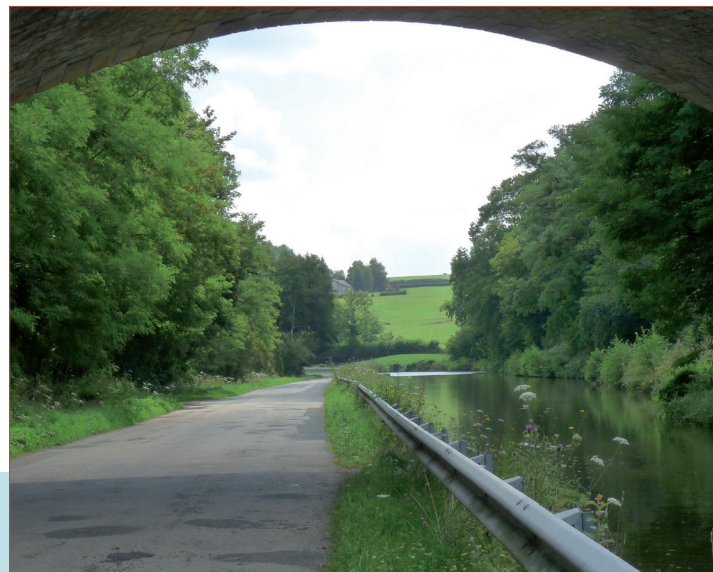
Canal du Centre