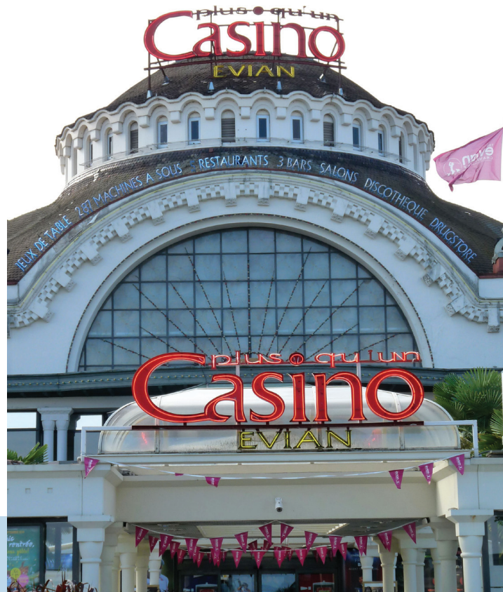
het Casino van Evian-les-Bains

De route is in principe als Tour du Léman en ook als ViaRhôna bewegwijzerd. Maar toen dit traject in 2016 werd verkend was de bewegwijzering nog onvolledig en de route hier en daar provisioneel; houd dus rekening met veranderde situaties. Vanwege de bewegwijzering is de routebeschrijving summier en alleen uitgebreider bij ontbrekende borden of onduidelijke situaties. Omdat vanaf St. Gingolph tot Thonon-les-Bains de officiële route nog deels over de drukke hoofdweg langs het Meer van Genève voert, is vanaf km 15.2 gekozen voor het Intinéraire sportif dat via de heuvels naar Evian voert. Dat betekent wel dat er een pittige klim wacht. Daarom, en ook omdat er nog enkele kilometers hoofdweg in zitten is dit traject niet geschikt voor kinderen. Thonon-les-Bains heeft een treinverbinding met Annemasse (op korte afstand van Genève) en verder met Lyon.