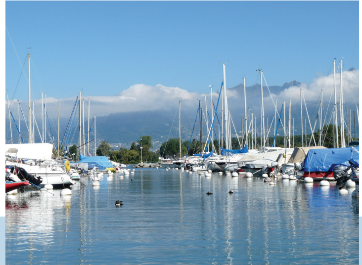
haven van Le Bouveret