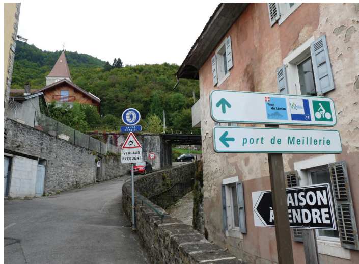
Meillerie, bewegwijzering ViaRhôna en Tour du Léman