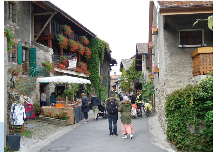
gezellige drukte in Yvoire