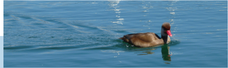
een krooneend op het Meer van Genève