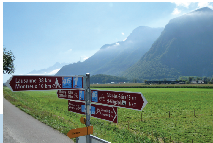
het begin van traject 17