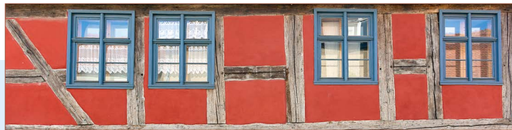
Oud vakwerkhuis in Brandenburg