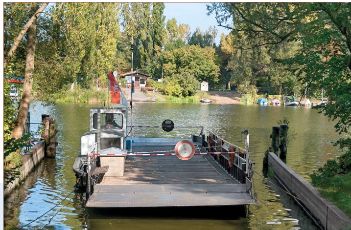
Pont over de Niederhavel