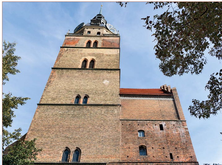
Katharinenkirche in Brandenburg